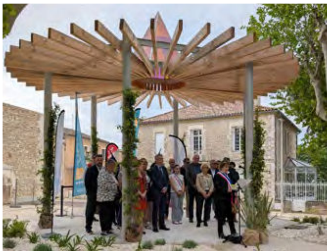
Un kiosque romantique place de la République