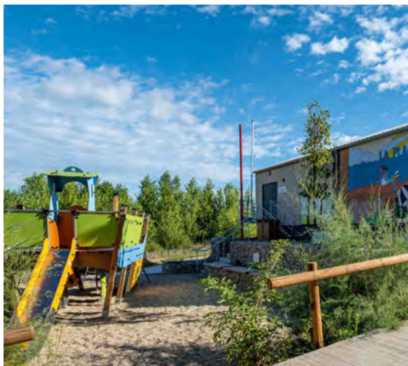
Poste de secours et jeux pour enfants à la plage des lacs

> Des lieux de respiration, de rencontre et de partage, pensés pour durer.